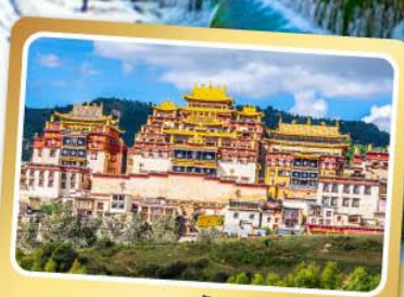
วัดลามะซงจ้านหลิน