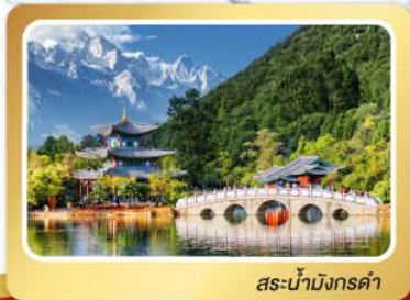
สะพานมิ่งคำ