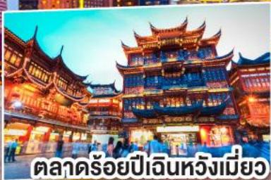
ตลาดร้อยปีเดินหวังเหมี่ยว