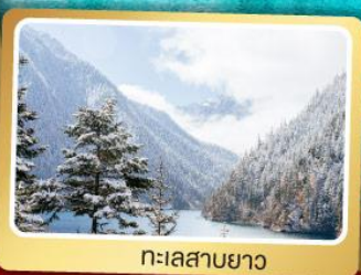
ทะเลสาบยาว