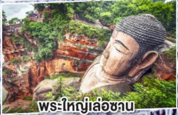
พระใหญ่เล่อซาน