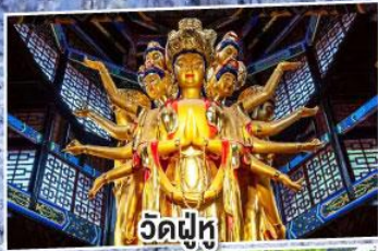
วัดฝู่ทู่