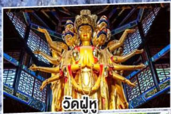
วัดฝู่ทู่