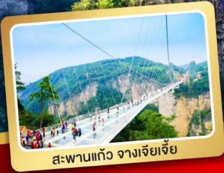
สะพานแก้ว จางเจียเจีย