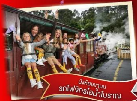
นั่งห้อยขาบน รถไฟจักรไอน้ำโบราณ