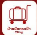
น้ำหนักกระเป๋า 20 kg