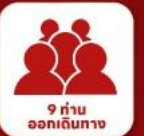
9 ท่าน ออกเดินทาง