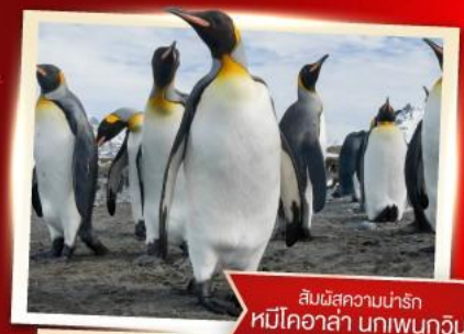
สัมผัสความน่ารัก หมีโคอาล่า นกเพนกวิน