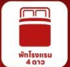
พักโรงแรม 4 ดาว