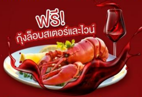
ฟรี! กุ้งล็อบสเตอร์และไวน์