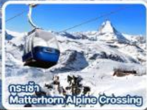
กระเช้า Matterhorn Alpine Crossing