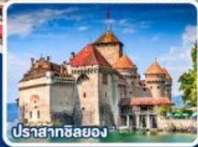
ปราสาทซิลยอง