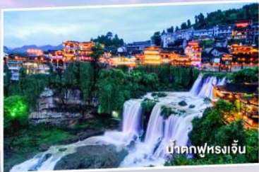
น้ำตกฟูหรงเจิน

เที่ยว 2 เมืองโบราณ ฟูหรง เฟิ่งหวง 5 วัน 4 คืน