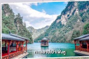
ทะเลสาบป่าเฟิ่งหู