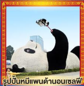
รูปปั้นหมีแพนด้าอนเซลฟ์