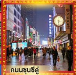
ถนนซุนซีลู่