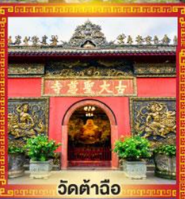
วัดต้าฉือ