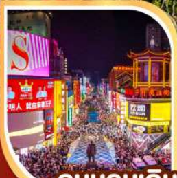
ถนนคนเดิน หวงซิงลู่