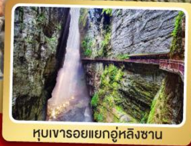
หุบเขารอยแยกอุ๋หลิงซาน