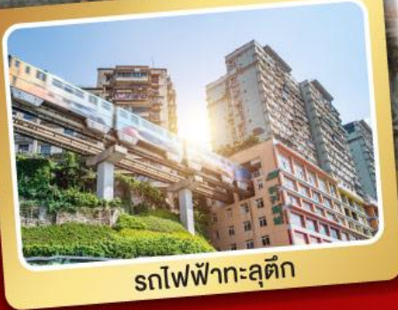
รถไฟฟ้ากะลุดัก