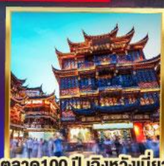
ตลาด100 ปี เฉิ่งหวังเมี่ยว