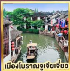
เมืองโบราณจูเจียเจี๋ย