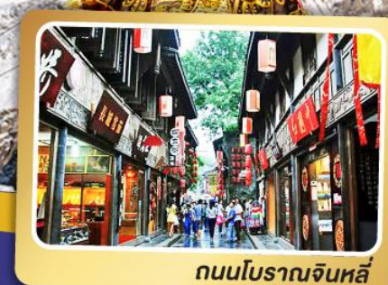
ถนนโบราณจีนลี่