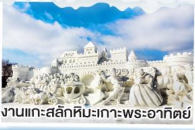
งานแกะสลักหิมะเกาะพระอาทิตย์