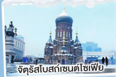
จัตุรัสโบสถ์เซ็นต์โซเฟีย