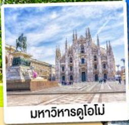
มหาวิหารดูโอโม

09-15 พ.ย. 67 28 ม.ค.-03 ก.พ. 68 12-18 มี.ค. / 11-17 เม.ย. 68 07-13 พ.ค. 68